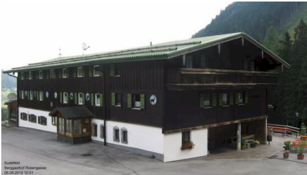
Gasthof Rosengasse (1125m)