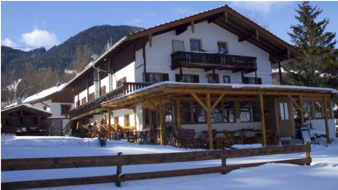
Bergasthaus Kraxenberger, St. Margarethen/Brannenberg

3.Tag: Bergasthaus Kraxenberger - Zahnradbahn zum Wendelstein - Wendelstein (1838m) - Elbachalm - Durhameralm (1307m) - Schweinsberg (1351m) - Kesselalm (1275m)